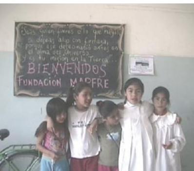
Escuela de Educación Especial N° 20 de Choele Choele, Provincia de Río Negro, Argentina, donde financiamos el equipamiento de un taller de carpintería para el desempeño de un oficio de adolescentes y jóvenes con necesidades educativas especiales

MAPFRE ha concretado su compromiso con la responsabilidad social en los siguientes nueve objetivos: