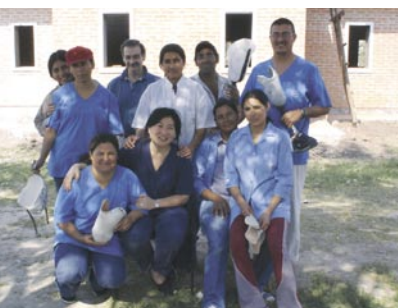
Médicos de MAPFRE ARGENTINA en El Chaco